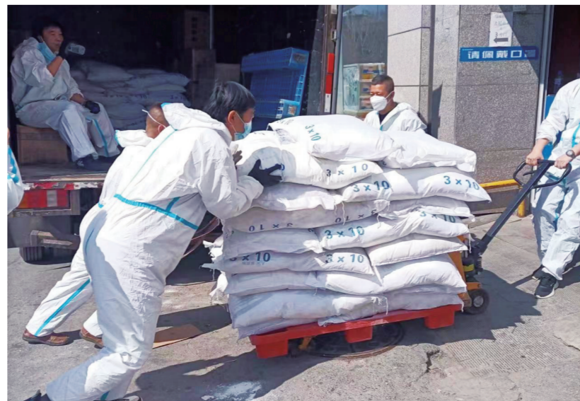
本轮疫情期间，欧亚车百超市为全力保障商品供应，紧急调配人员装配集团自采五得利面粉。

在这场“战疫”中，欧亚人挥洒了无尽的汗水与泪水，让我们永远心怀感恩之心，知重负重，担责前行。